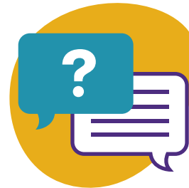
Apprendre les uns des autres

5 Les jeunes veulent qu'on leur donne des outils de leadership d'une manière responsabilisante et non prescriptive.